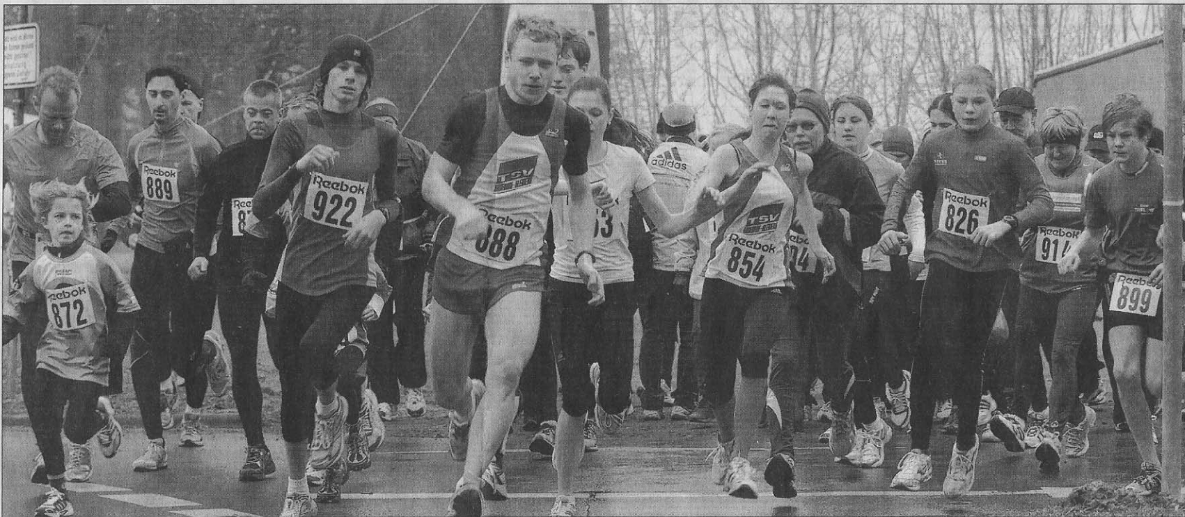
Die „Fünfer“ gehen auf die Strecke in der Wieseckau.