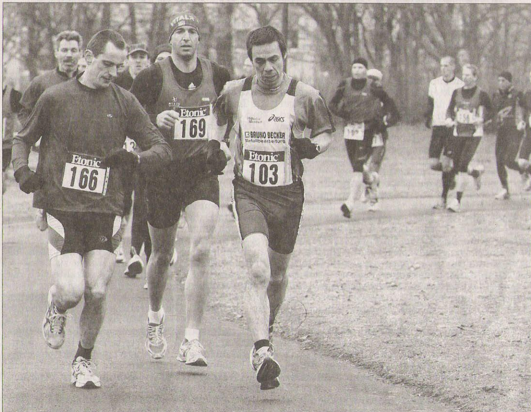
Kurz nach dem Start geht auch beim 35. Gießener Frühjahrslauf der LGV Marathon der Blick vieler Teilnehmer zur Kontrolle auf die Uhr.